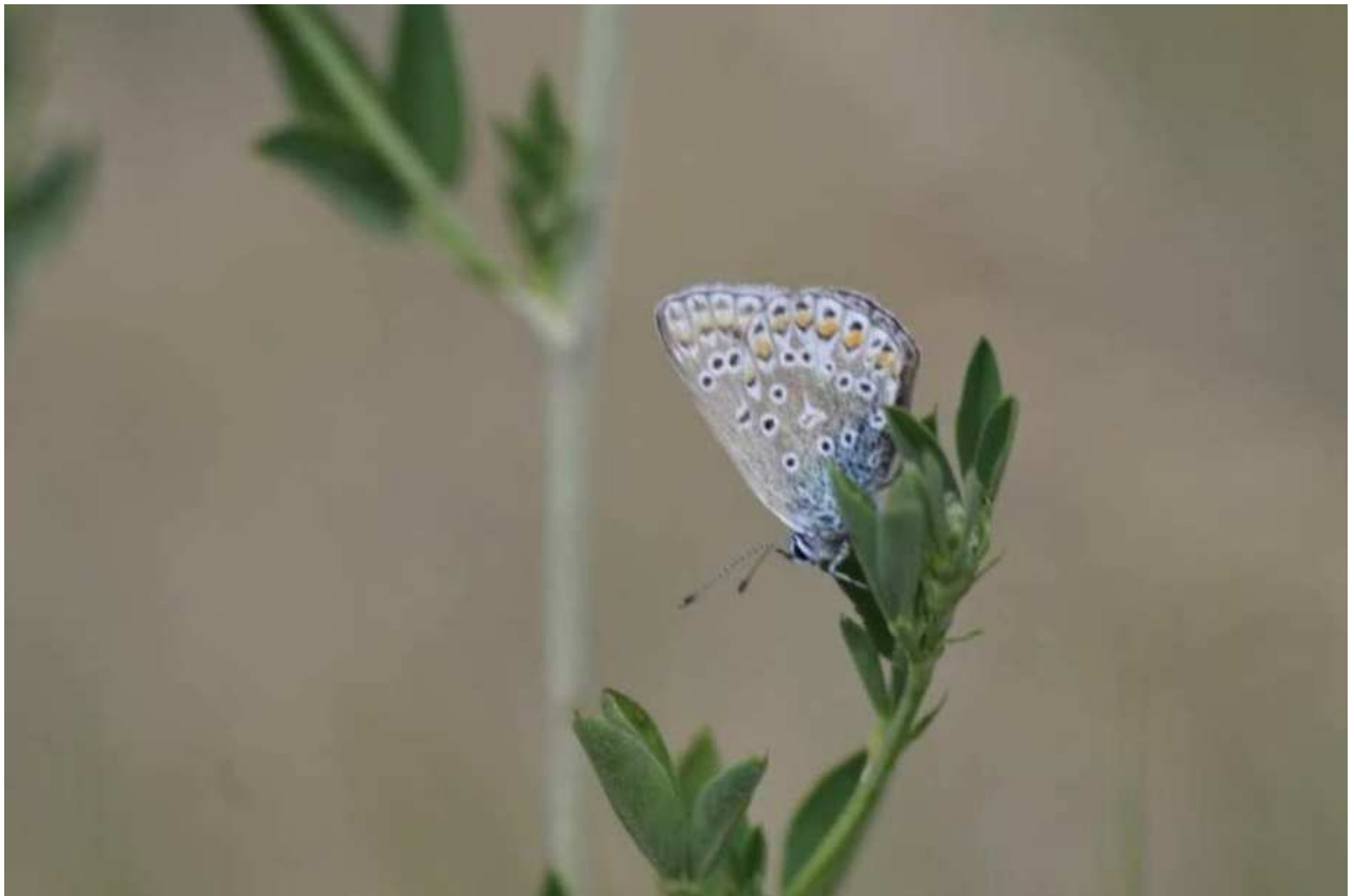
Abbildung 3: Hauhechel-Bläuling im Untersuchungsgebiet ( Polyommatus icarus )