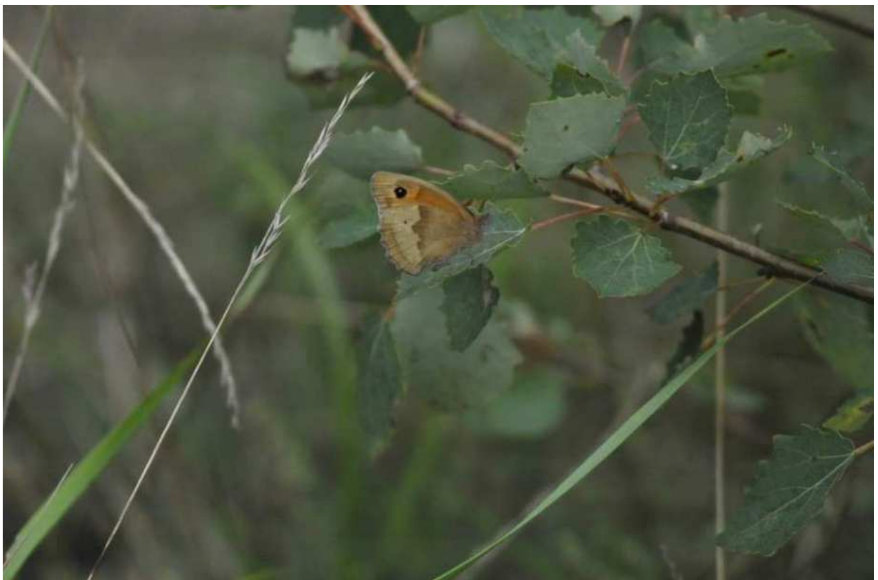
Abbildung 5: Großes Ochsenauge im Untersuchungsgebiet ( Maniola jurtina )