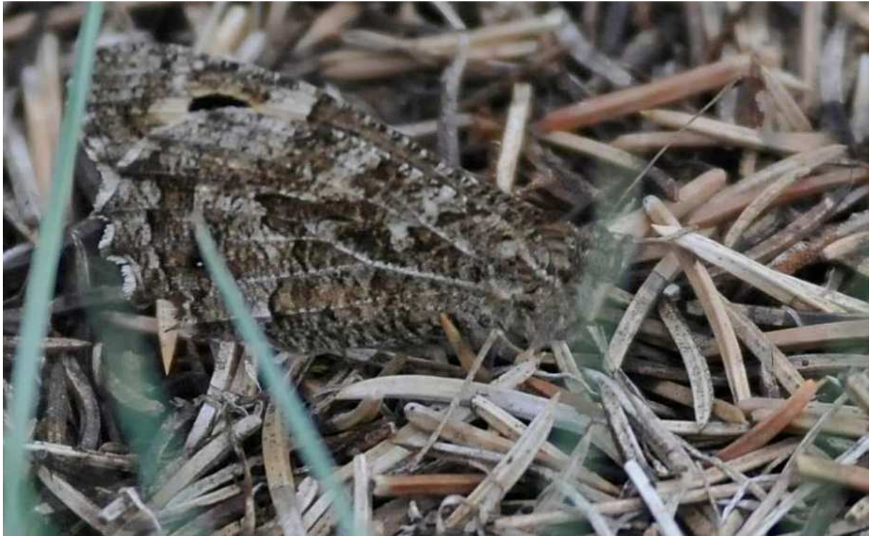
Abbildung 2: Ockerbindiger Samtfalter im Untersuchungsgebiet ( Hipparchia semele )