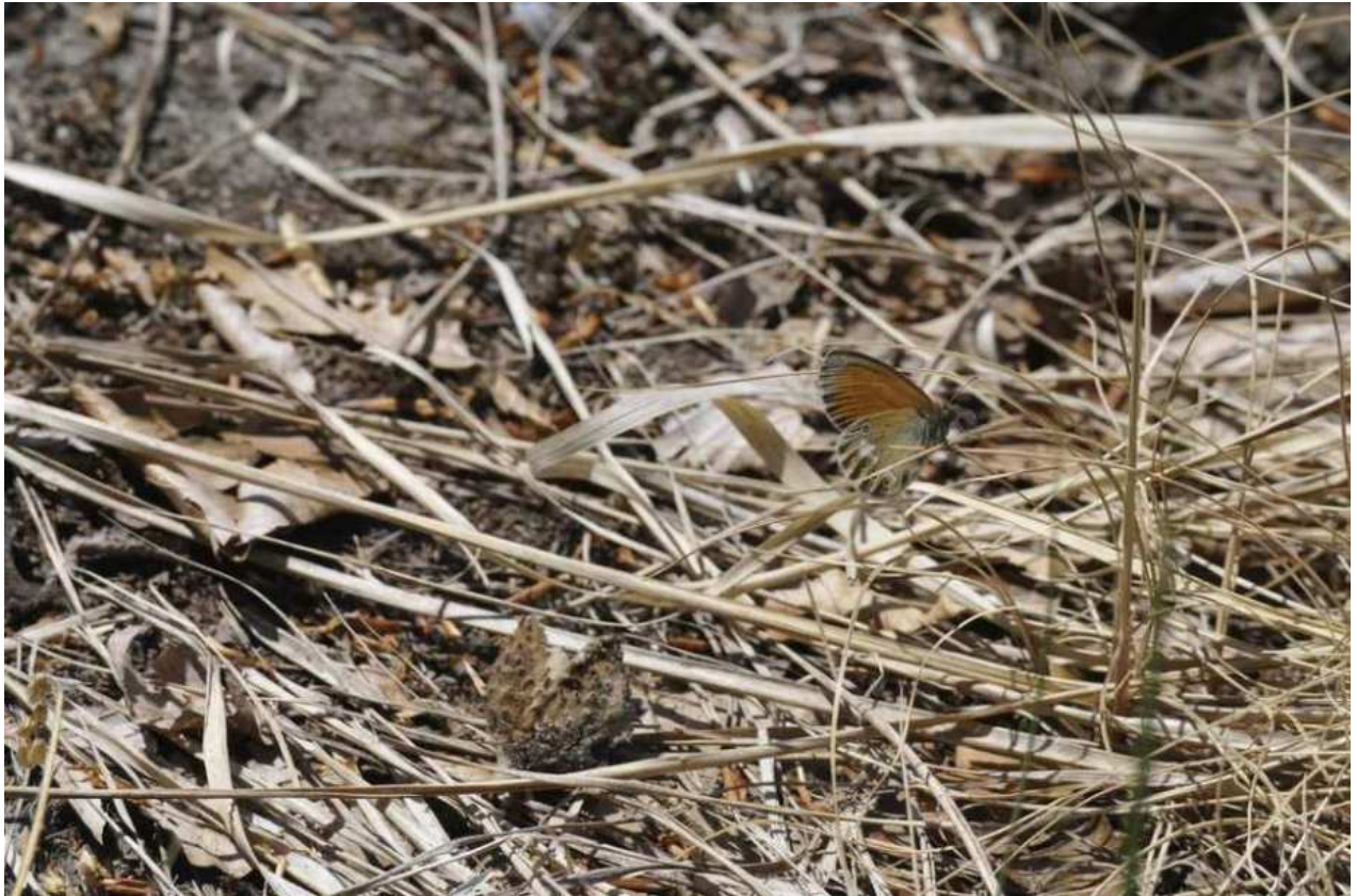
Abbildung 4: Rostbraunes Wiesenvögelchen im Untersuchungsgebiet ( Coenonympha glycerion )